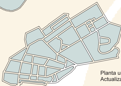
Planta urbana Actualización 2010